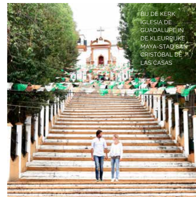
BIJ DE KERK IGLESIA DE GUADALUPE IN DE KLEURRIJKE MAYA-STAD SAN CRISTÓBAL DE LAS CASAS